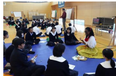
インターナショナルデー

前橋市の西端、榛名山の裾野に位置しています。 自然が豊かで、素晴らしい環境に囲まれています。