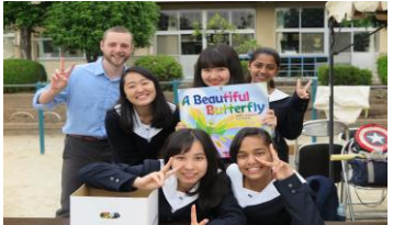
イングリッシュクラブ